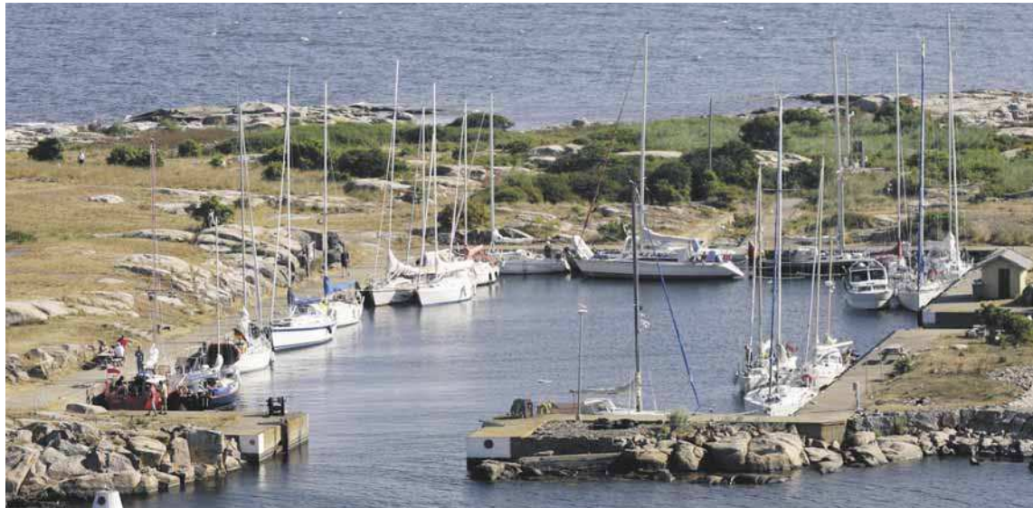
VILA. Den skyddade hamnen är populär så här års. Många båtar på långa seglatsar stannar till för att pusta ut på väg mot fortsatta äventyr.