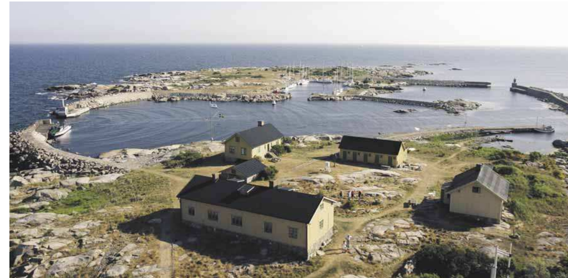
UTKLIPPAN. På Södraskär ligger kafé, ornitologernas stuga och ett vandrarhem. En roddtur tvärs över leder till gästhamnen och glasskiosken.